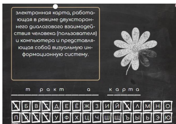
Рис. 3. Задание «Поле чудес»

Также в работе предусмотрено тестирование, проверка знаний.