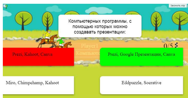
Рис. 1. Скачки

Например, представленное задание (рис. 1) можно играть с друзьями или с компьютером как беговые скачки: первый придет тот к финишу, кто больше всех ответит правильно на вопросы.