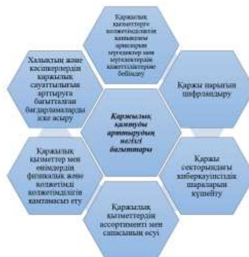
Сурет 8. Қаржылық қамтуды арттырудың негізгі бағыттары [4]

IT-технологияның дамуы мен қолжетімділігінің артуына байланысты географиялық кедергілер жойылуда. Қаржылық қамтуды арттырудың негізгі бағыттары 8-суретте көрсетілген.