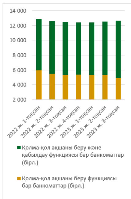
Сурет 7. 2022-2023 жылдарға арналған Қазақстан Республикасындағы банкоматтар санының динамикасы [5]

Сондай-ақ соңғы 5 жылда банкоматтар санының 2022 жылғы 11,7 мыңнан 2021 жылы 12,8 мыңға дейін өскені байқалады (7-сурет).