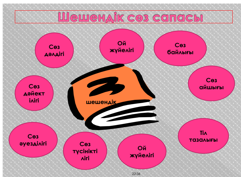
Сурет 2. Шешендік сөз сапасы

Осы жоғарыдағы қазақ даналығының айғағы іспеттес тарихы ежелден бастау алатын ұлттық құндылықтарымызды айқындаған, халықтық дәстүрді саралаған тілі ділмәр, шешендердердің ішінде сөзі ерек Төле биді айтуға болады.